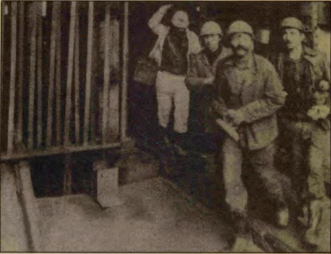
Karanlığı yarıdık, yeniden karanlıklara gömülmeyi devrimle engelleyeceğiz

15-16 Haziran'ları yaratırlar, DGM yasasını yasalasızdan rafa kaldırtırlar, 1 Mayıs'ta kızılları deniz oluştururlar, Tarih barikatlarında çarpışanlar bugün sınıf savaşımının ta göbeğindedirler. "Kritik" sorunların patlak vermesini hızlandırma gereğini kuşkusuz onlar da görüyor ve çeşitli yollardan yerine getiriyorlardı. Biz burada bu yollardan birinin önemini vurgulayacağız: O da Türk-İş yönetiminin oyalama taktiğini, özellikle de Türk-İş tabanında yoğun olarak sergilemektir.