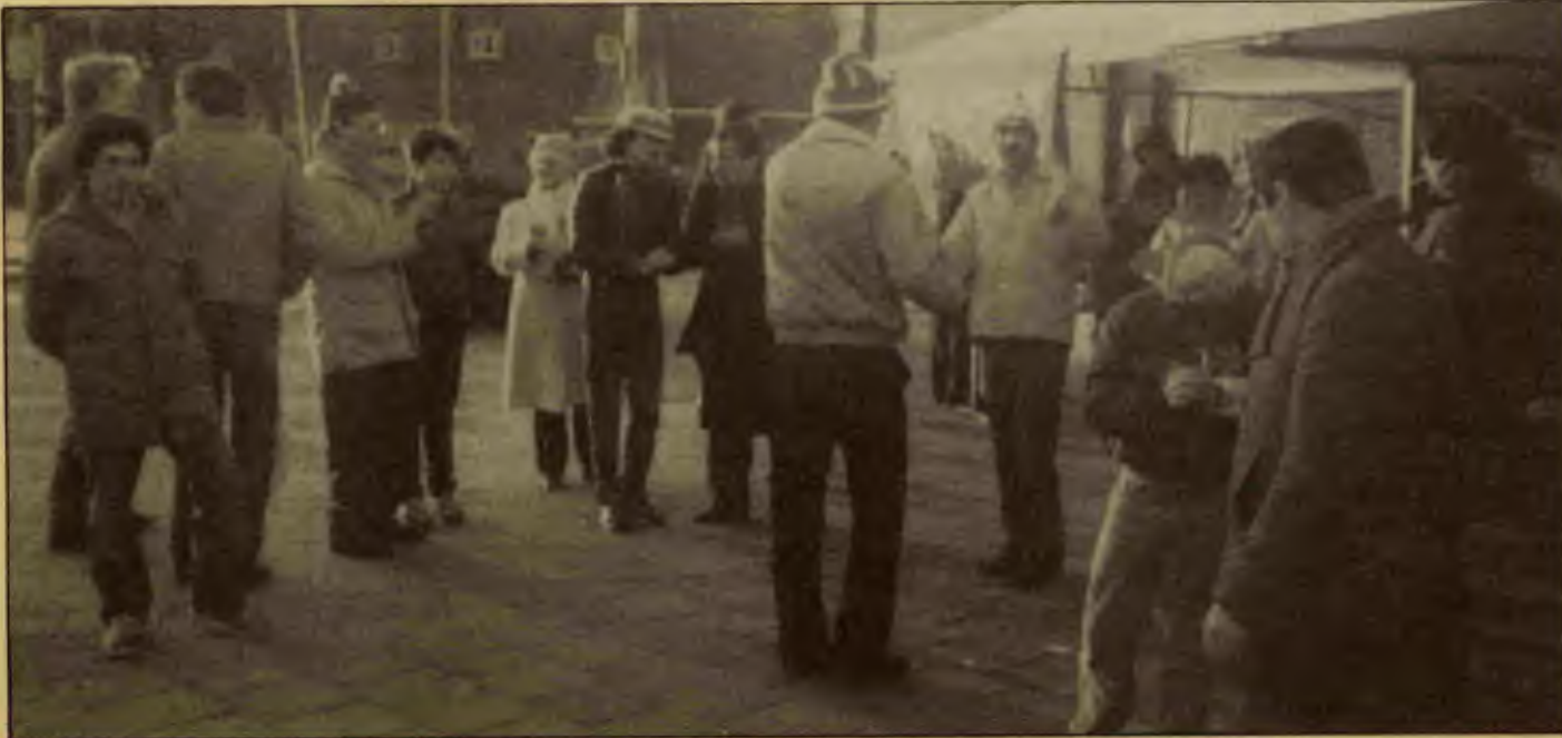
Rotterdam'da pazar işçilerinin 2. grevinden bir görüntü

Saat 11.00 civarıydı. Bu sırada, patron ve yanında otuz kadar köpekli polisin yanımıza geldiğini gördük. Bu durumda işçi arkadaşlar şaşırıp kaldık. Çünkü, bir gün önce polis, bizim eylemimize karışmayacağına dair söz vermişti. Gerçekten de polisi ilgilendirir birşey yoktu. Biz gaspedilen bazı haklarımızı almak için grev silahını patrona